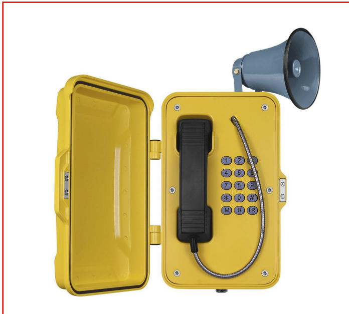
Teléfono resistente a la intemperie