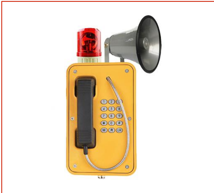
Teléfono resistente a la intemperie