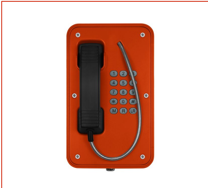
Teléfono resistente a la intemperie