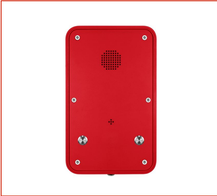
Teléfono resistente a la intemperie